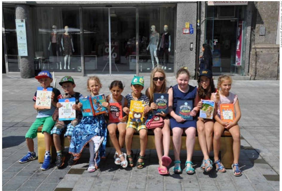
Zakończenie roku szkolnego 2017/18

W ostatnich latach działalność „MOWY” znacznie się rozszerzyła. Oprócz wydarzeń edukacyjnych organizowane są spotkania tematyczne, wspólne wyjścia do kina, na wystawy czy wykłady. Dzięki temu coraz więcej osób znajduje swoje miejsce w stowarzyszeniu i aktywnie współtworzy jego inicjatywy, wspierając rozwój całej społeczności swoją wiedzą i doświadczeniem.