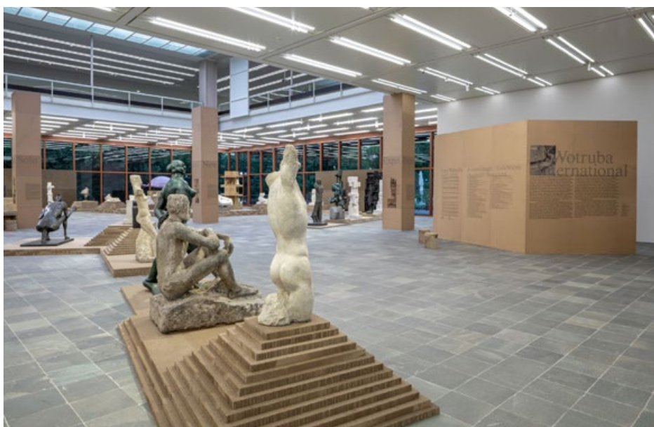
Wśród rzeźb Fritza Wotruby – wystawa Wotruba International w Belvedere 21

Brutalizm pozostawił po sobie wiele ikon architektury: siedzibę Banku Gruzji w Tbilisi, Zachodnią Bramę Belgradu (1977), londyńskie National Theatre i Trelick Tower, a w Ameryce – Habitat 67 w Montrealu czy Boston City Hall. W Polsce również odnajdujemy jego ślady: krakowski Bunkier