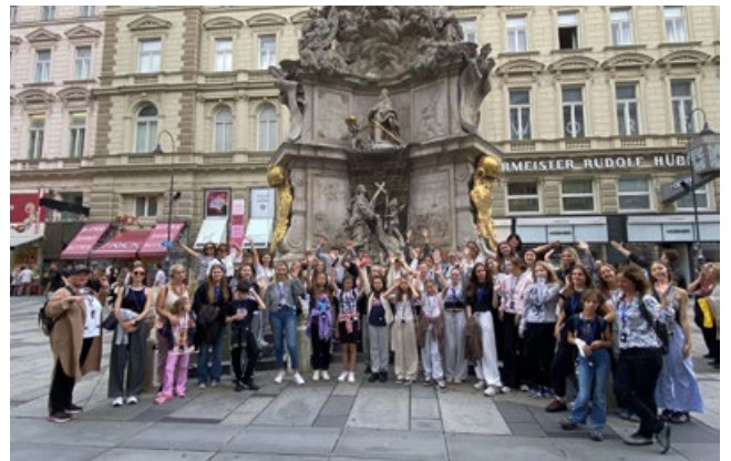
W centrum Wiednia

Kolejnym ważnym punktem programu była wizyta w ogrodach Pałacu Schönbrunn – jednej z największych atrakcji Wiednia i dawnej letniej rezydencji cesarskiej. Wśród barokowej