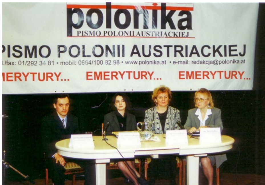
Jedno ze spotkań informacyjnych