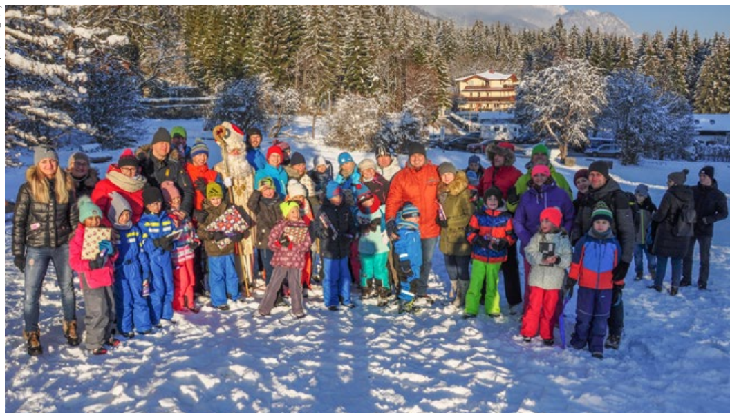
Rodzinne ognisko mikołajkowe, 2018

„MOWA” to coś więcej niż słowa – to radość spotkań i bogactwo wymiany myśli, dzięki którym Polonia w Tyrolu pielęgnuje polskość i wspólnie angażuje się w twórcze działania.