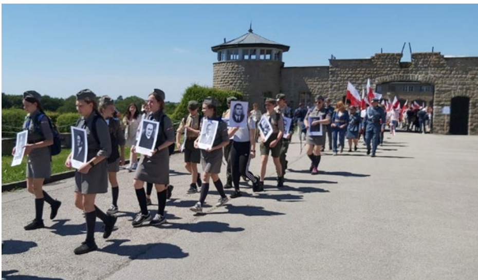
Marsz Pamięci Mauthausen-Gusen

W medioznawstwie istnieje określenie etnomedium – oznacza ono czasopismo, portal lub stację radiową tworzoną przez mniejszość narodową lub etniczną dla swojej społeczności. W tym sensie „Polonika” jest najstarszym etnomedium w Austrii, a zarazem jednym z najtrwalszych