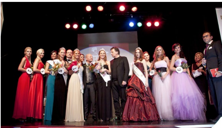
Wybory Miss Polonii w Austrii

W ciągu tych trzech dekad nauczyliśmy się, że czasopismo jest jak dom. Zmienia się wystrój, pojawiają się nowe pokoje, czasem coś się odnawia, coś znika. Ale fundamenty pozostają – wspólnota, pamięć, język. „Polonika” nie musi być największa ani najnowocześniejsza. Jej siła tkwi w tym, że od trzydziestu lat mówi naszym głosem – spokojnym, serdecznym, uważnym. Nie goni za sensacją, tylko za sensem. Dlatego patrząc w przyszłość, nie boimy się zmian. Bo wiemy, że dopóki będą ludzie, którzy chcą pisać, fotografować, pamiętać i rozmawiać – dopóty będzie trwała nasza wspólna historia. Nie zamknięta