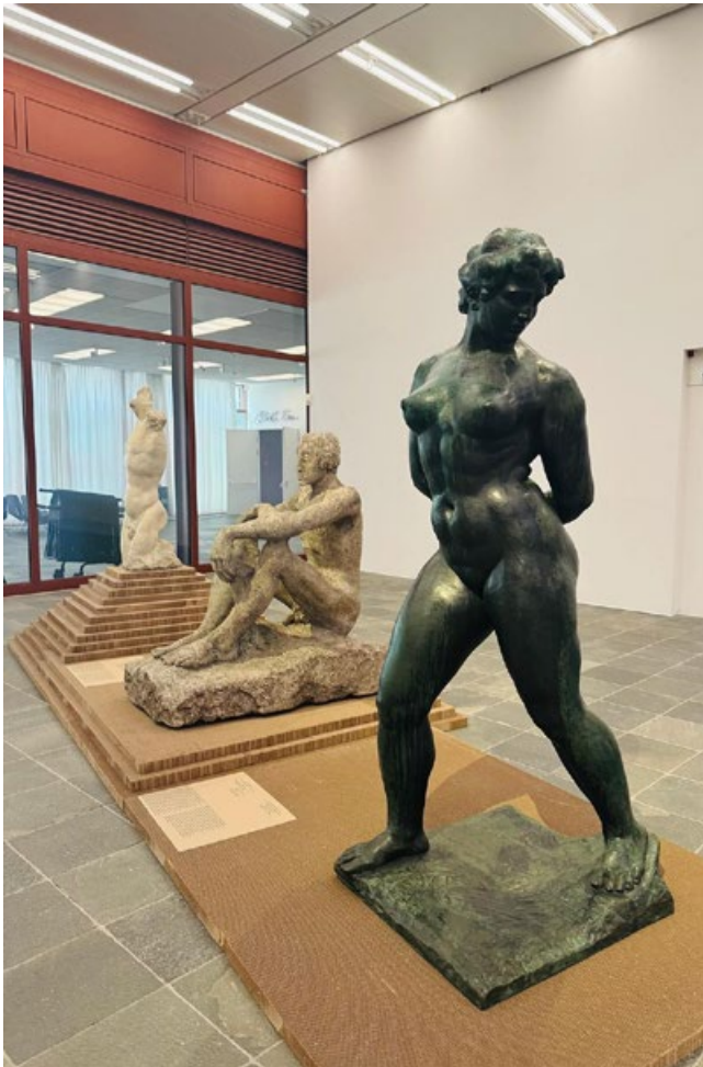
Artysta, który zamienił beton w poezję – wystawa Wotruba International w Belvedere 21

Sztuki, Kino Kijów, Halę Forum, katowicki Spodek czy warszawskie osiedle Za Żelazną Bramą. Budynki tego stylu do dziś dzielą opinie – prowokują, zaskakują, ale też zachwycają swoją bezkompromisową szczerością.