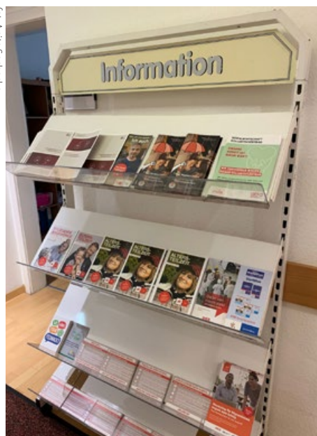
Centrum Doradcze istnieje od 1983 roku, działa na zlecenie AMS

– Przekrój narodowości jest bardzo szeroki. Gdy widzimy wzrost zapotrzebowania wśród danej grupy językowej, staramy się odpowiednio reagować. W ostatnich latach przybyło