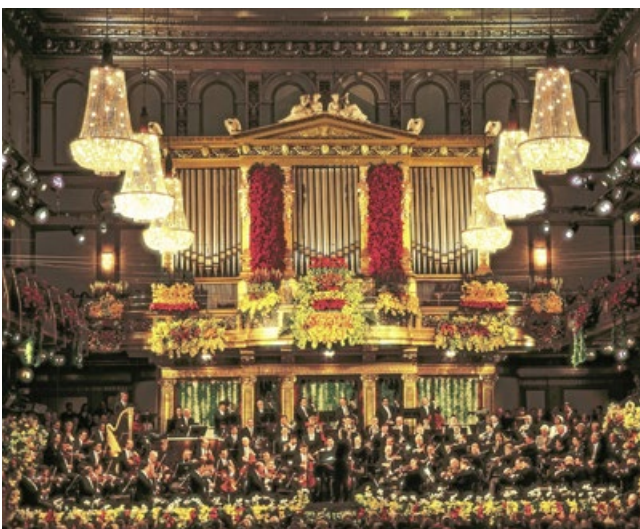
Koncert Noworoczny w Złotej Sali Musikverein