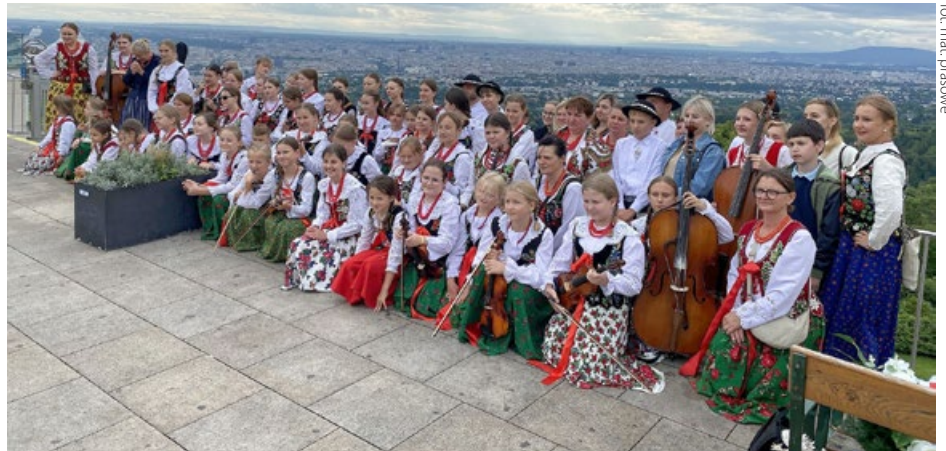
Na wzgórzu Kahlenberg

Po Mszy młodzież zwiedziła muzeum przy kościele na Kahlenbergu, gdzie znajdują się pamiątki związane z bitwą pod Wiedniem w 1683 roku i postacią króla Jana III Sobieskiego. Niezwykle cennym doświadczeniem była także lekcja historii prowadzona przez panią kustosz świątyni, która w żywy i poruszający sposób przybliżyła młodzieży kontekst tej wielkiej victorii.