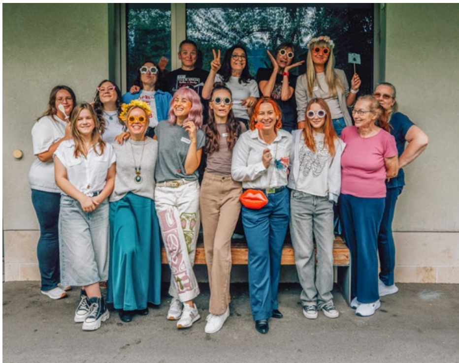
Kobiety na jednym ze spotkań zorganizowanym wspólnie z „Polką na zagraniczu”

Po kilku latach starań rozpoczęły się zajęcia w ramach austriackiego systemu szkolnictwa, prowadzone już