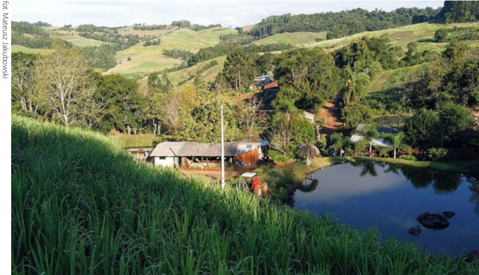
„Dom Polski” rodziny Sikovskich