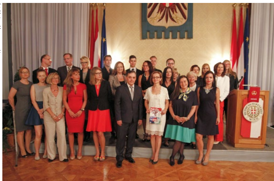
Zespół redakcyjny w Ratuszu wiedeńskim

Nie brakowało też tematów poważnych. Niektóre okładki przypominały o ciemnych stronach emigracji. Tytuły