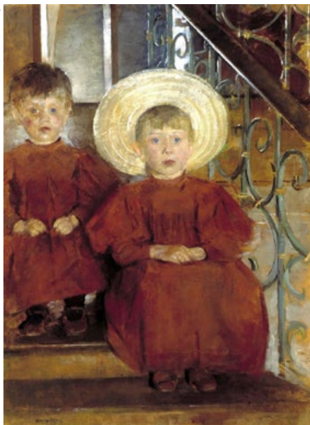
Dzieci na schodach , 1898 r., Muzeum Narodowe w Poznaniu

Boznańska miała ogromną wrażliwość na życie, także to najmniejsze. W jej paryskiej pracowni zawsze obecne były zwierzęta: pieski, ptaki, a nawet myszki, którymi opiekowała się z czułością. Współcześni wspominali ją jako osobę delikatną, empatyczną i troskliwą. Ta cicha miłość do zwierząt i do świata w ogóle przenikała również jej malarstwo: subtelne, skupione, pełne zrozumienia dla kruchości istnienia.