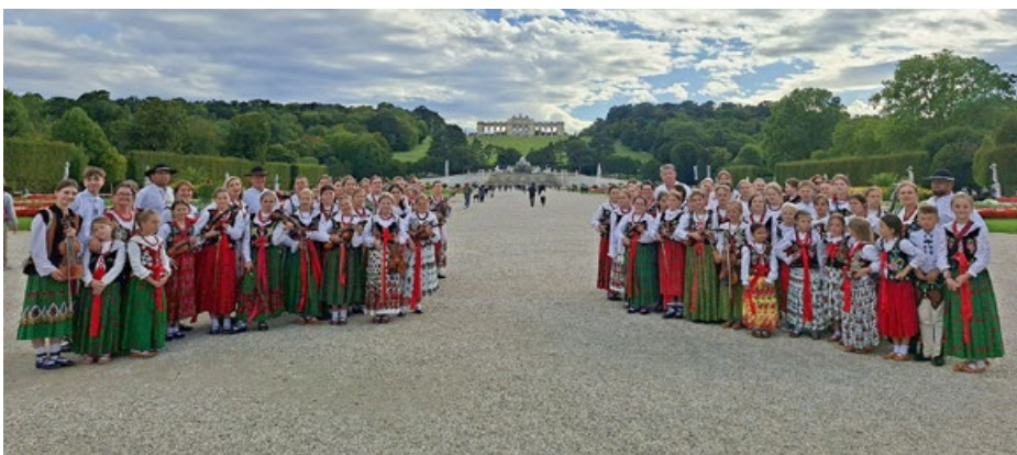
W ogrodach Pałacu Schönbrunn

Było wspaniale – pełni radości i wdzięczności już nie możemy się doczekać kolejnych wspólnych wyjazdów!