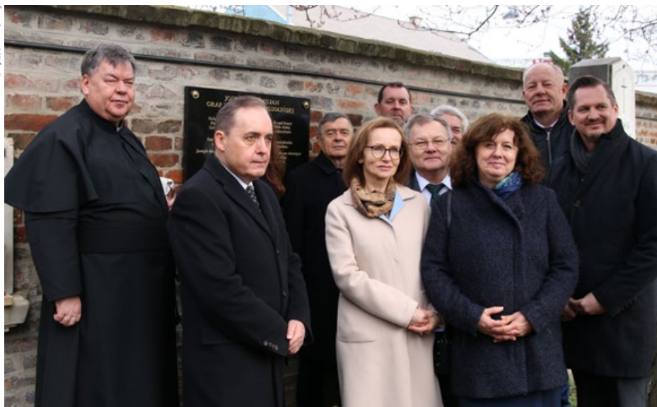
Uroczystość odsłonięcia pamiątkowej tablicy Józefa Maksymiliana Ossolińskiego

W 2011 roku, w pierwszą rocznicę katastrofy smoleńskiej, z inicjatywy redakcji „Poloniki”, w budynku Stacji Naukowej PAN w Wiedniu powstała, a następnie zawisła tablica poświęcona ostatniemu prezydentowi RP na uchodźstwie, Ryszardowi Kaczorowskiemu. Pięć lat później, w 1050.