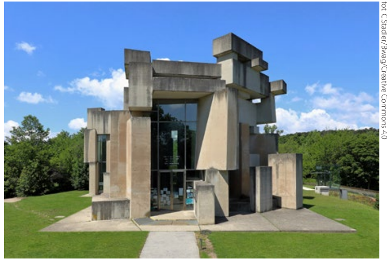
Wotrubakirche /Kościół Świętej Trójcy w Wiedniu