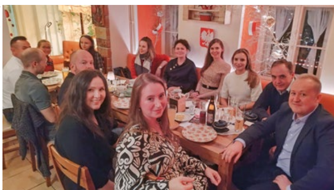
Tak świętowaliśmy nasze 15. urodziny

W 2009 roku na polonijnej scenie Wiednia brakowało organizacji, która zajęłaby się integracją młodego pokolenia Polaków. Wtedy narodził się pomysł stworzenia czegoś nowego. Rok później inicjatywa przyjęła nazwę ŻUBRY – Młoda Polonia Wiedeń i została zarejestrowana jako stowarzyszenie.