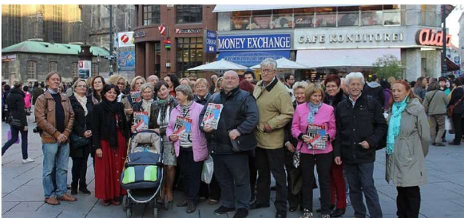
Spacery po Wiedniu z „Poloniką”