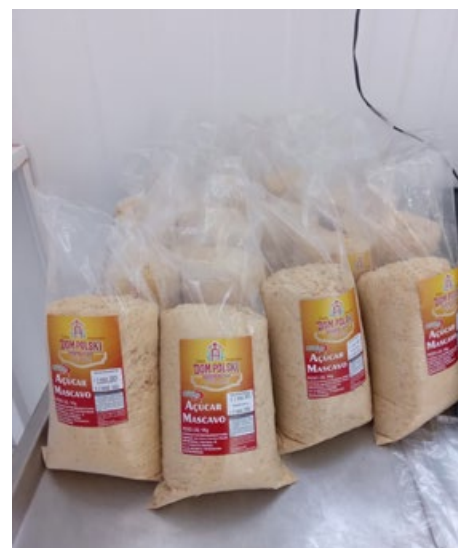
Cukier z plantacji „Dom Polski”

To naprawdę wyjątkowe miejsce. Jedynie nazwa miejscowości budzi pewien żal... Nie zawsze było to Carlos Gomes. Początkowo osadę nazwano Sede dos Polacos („Siedziba Polaków”), a później przemianowano ją na bardziej przyjazną – Nova Polônia („Nowa Polska”). Niestety, nazwa ta nie przetrwała czasów rządów nacjonalistycznego prezydenta Getúlio