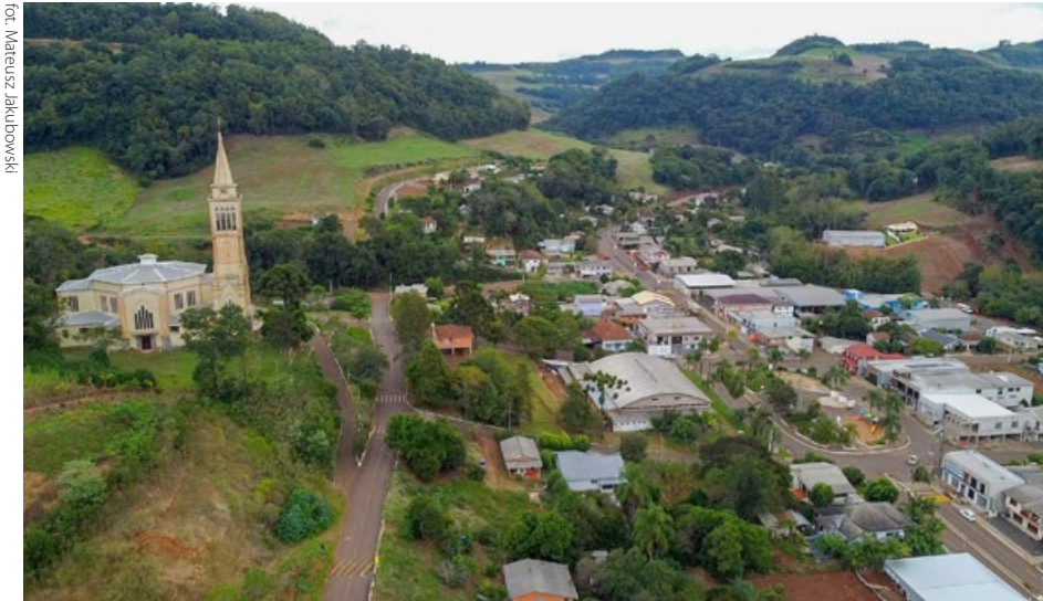
Carlos Gomes – miejscowość, która dawniej nosiła nazwę Sede dos Polacos („Siedziba Polaków”), a następnie Nova Polônia („Nowa Polska”)

Aż trudno mi uwierzyć, jak ten czas leci. Po podróży do Brazylii w 2019 roku zapowiadałem, że szybko tam wrócę. Lata mijały, a ja szukałem Polonii w innych państwach. Brazylię cały czas czekała – rok, drugi, piąty... Wróciłem dopiero teraz, w 2025 roku. W zupełnie innych, dużo lepszych, a na pewno łatwiejszych okolicznościach, niż poprzednio.